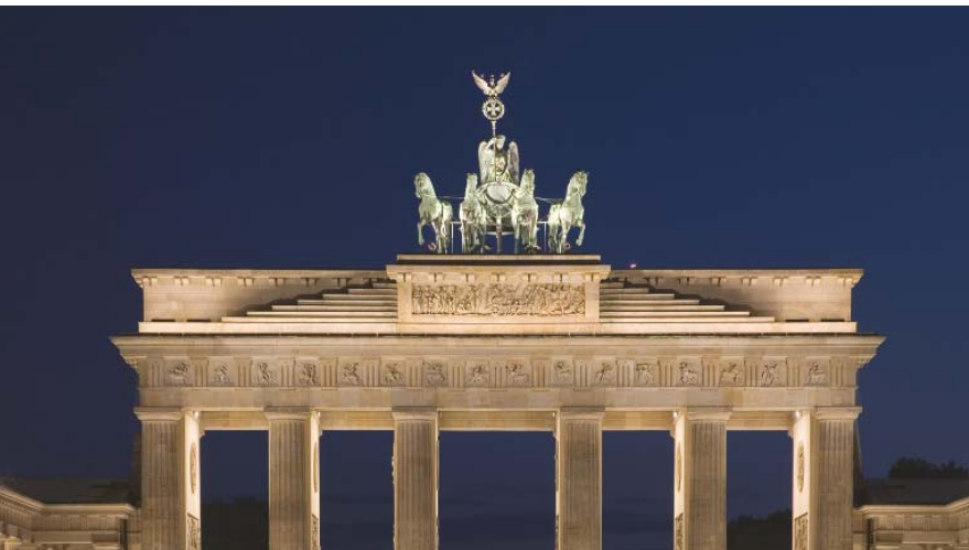
Geordnete Verhältnisse in Berlin herstellen.

Die Bundestagswahl am 27. September 2009 beendet den diesjährigen Wahlmarathon. Die FDP hat das richtige Programm für die Übernahme an Regierungsverantwortung! Ihr Programm steht für eine Politik der Mitte.